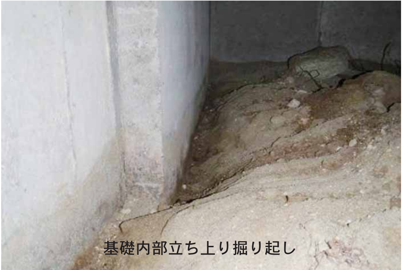
基礎内部立ち上り掘り起し