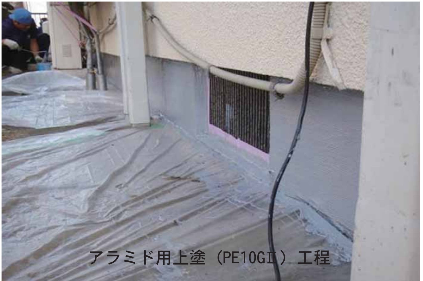
アラミド用上塗（PE10GII）工程