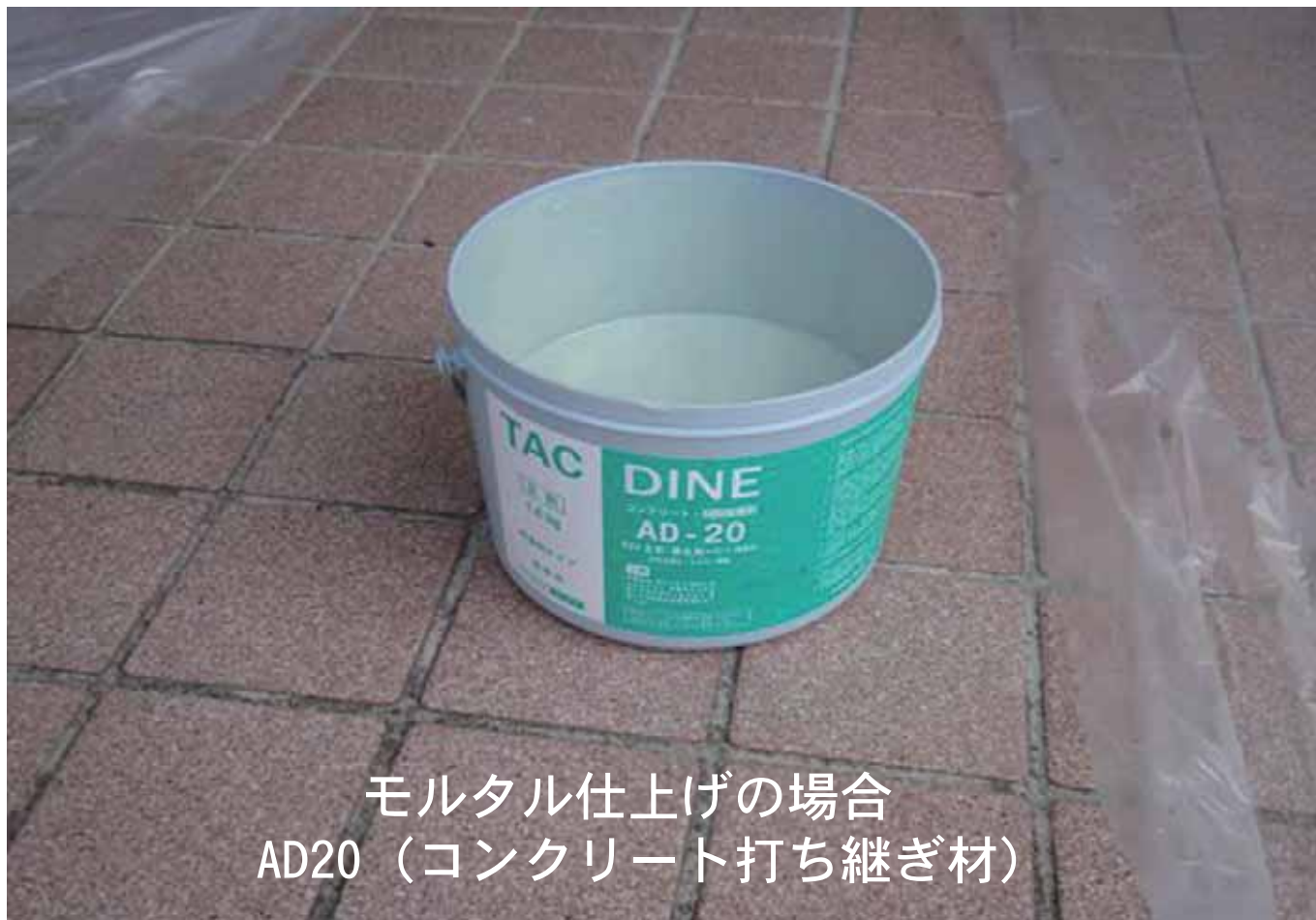
モルタル仕上げの場合 AD20（コンクリート打ち継ぎ材）