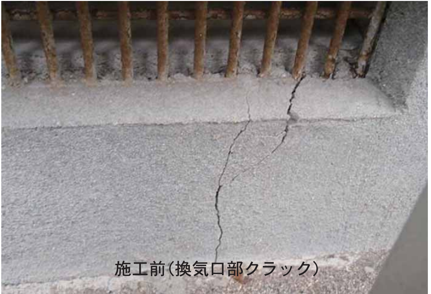
施工前(換気口部クラック)