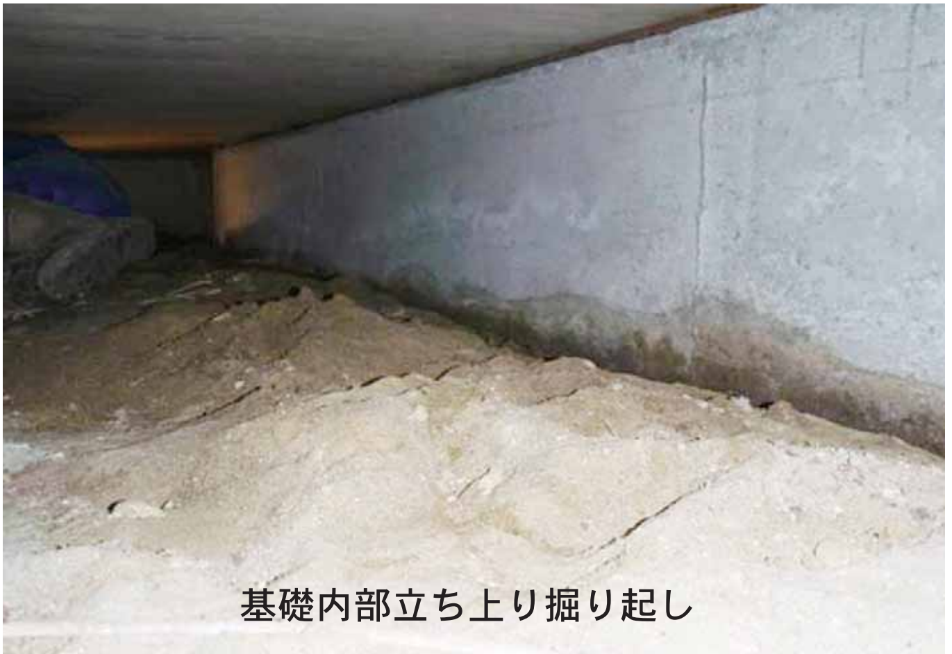
基礎内部立ち上り掘り起し