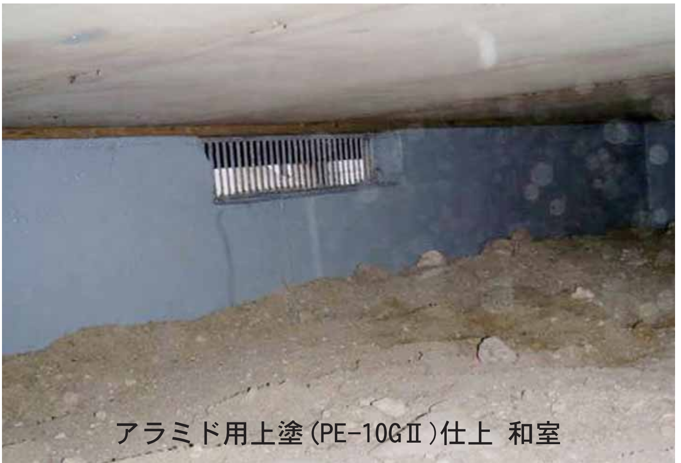
アラミド用上塗 (PE-10GⅡ) 仕上 和室