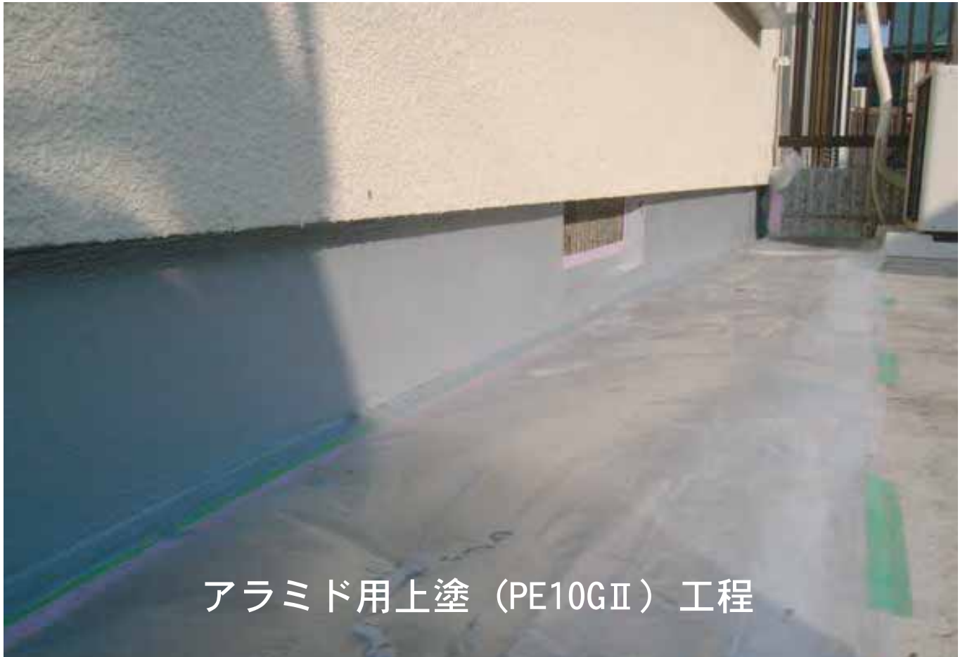
アラミド用上塗 (PE10GII) 工程