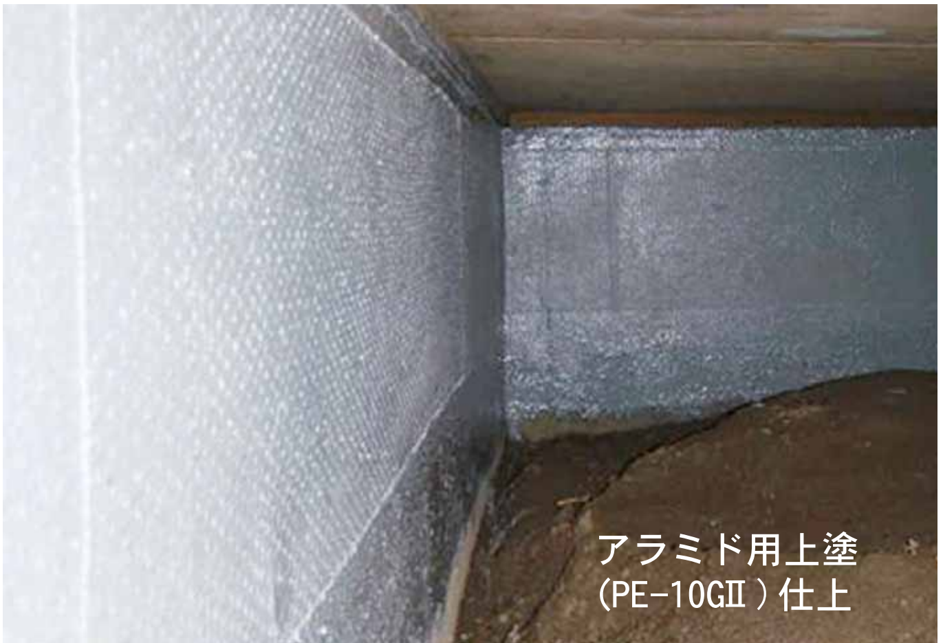
アラミド用上塗 (PE-10GⅡ) 仕上