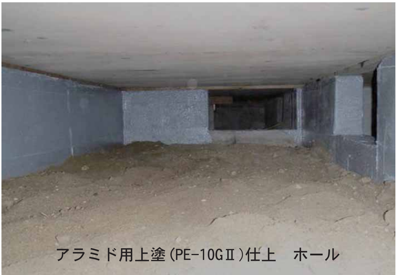
アラミド用上塗 (PE-10GⅡ) 仕上 ホール