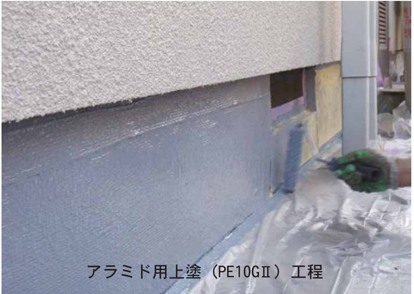
アラミド用上塗（PE10GII）工程