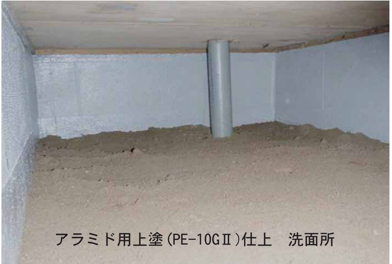
アラミド用上塗 (PE-10GⅡ) 仕上 洗面所