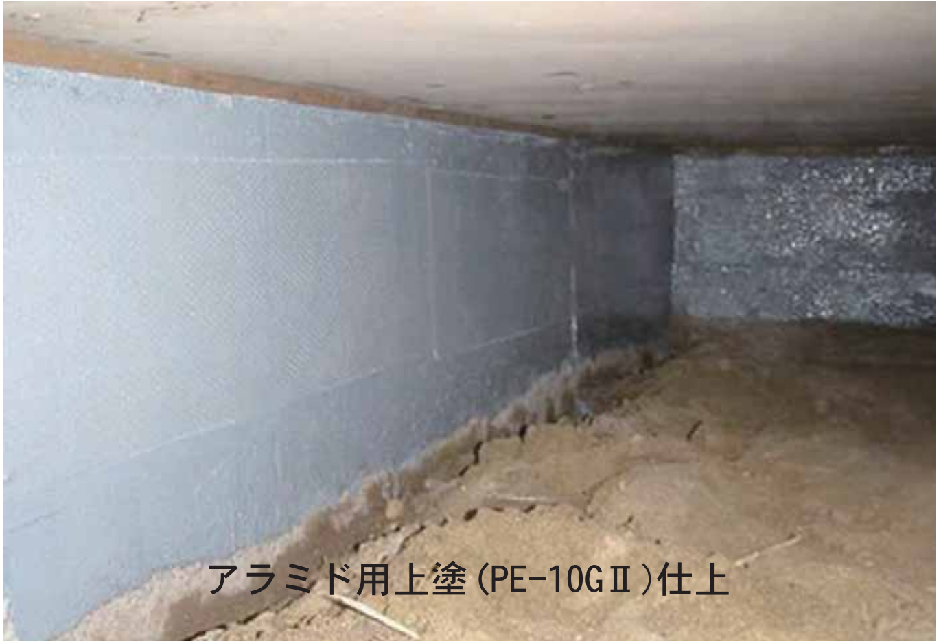
アラミド用上塗 (PE-10GⅡ) 仕上