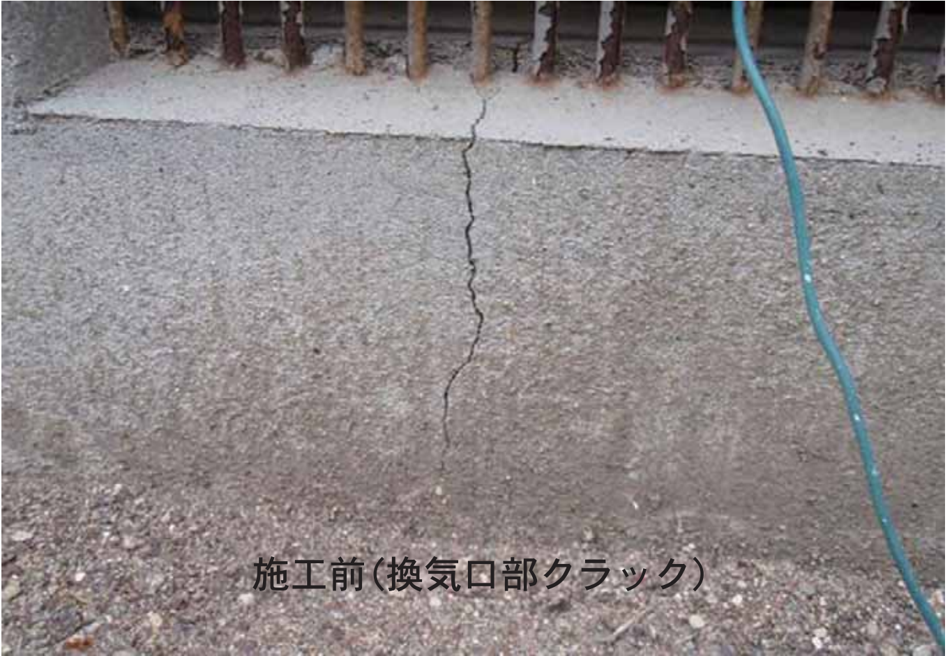
施工前(換気口部クラック)