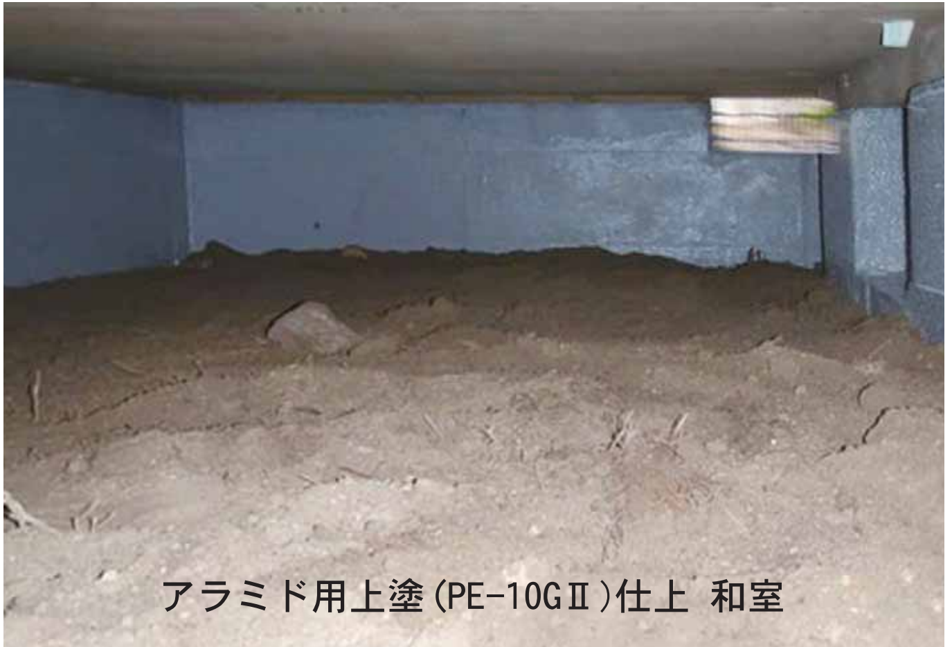
アラミド用上塗 (PE-10GⅡ) 仕上 和室