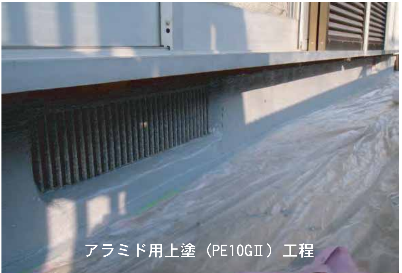
アラミド用上塗 (PE10GII) 工程